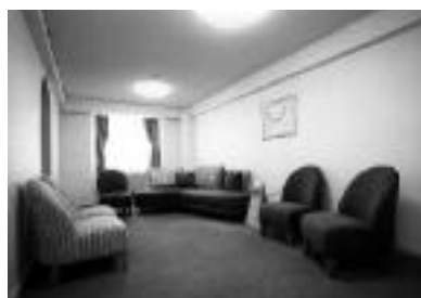
患者さん同士が会合する落ち着いた雰囲気の一部

現在、サポートグループは、14グループで計113人の患者さんが会合に出席しサポートを受けている状況です。会員は増加中であり、今後もグループ数は増加する予定です。