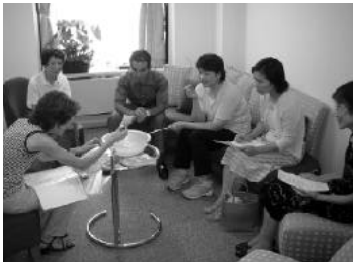
ハーブの心地よい香りを楽しむアロマセラピー

自律訓練法は、心身の緊張状態を緩和することで人の心にかかるストレスを軽減させるための方法で、心身症や神経症など自律神経症状の治療・予防の方法として用いられています。がん患者さんは、日常的に大きな不安（ストレス）をかかえていて、それが何かのき