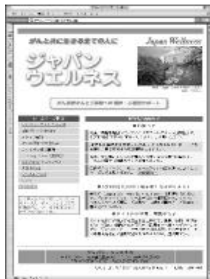
ジャパンウエルネスのホームページ http://www.japanwellness.jp

もいらっしゃいます。そうした方々のために、どなたでも参加できる「継続サポートグループ」も開催しています。