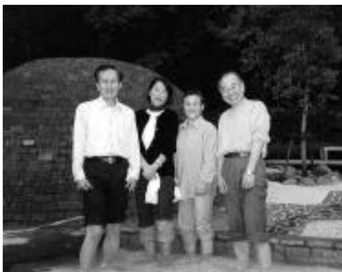
湯河原温泉「足の湯」にて

新聞で、ジャパン・ウエルネスを知り、サポートグループ木曜日の会に参加し、同じ病気をした人たちの話を聞き、自分一人ではかかえていた悩みを打ち明け、心が少しずつ軽くなっていくのを感じました。