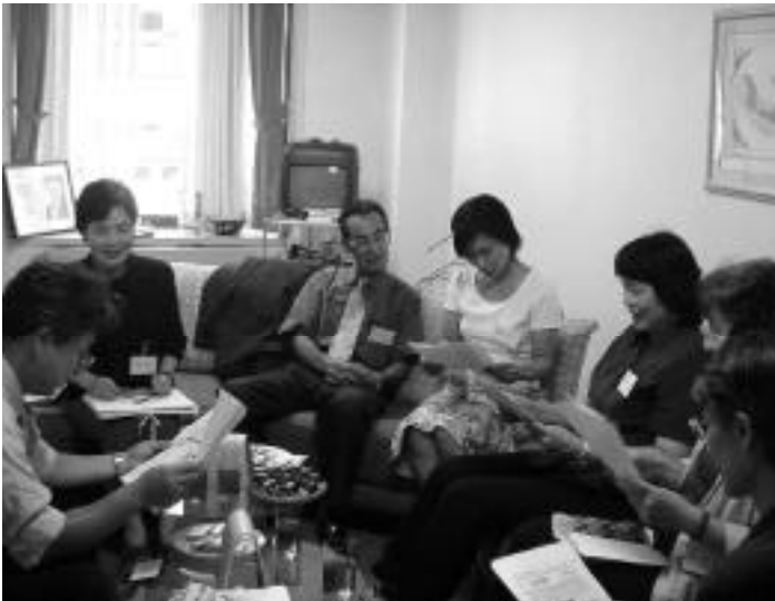
患者さん同士がお互いの状況について話し合う