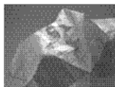
全面ドレープ 眼科