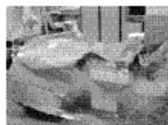
全面ドレープ カリ検査